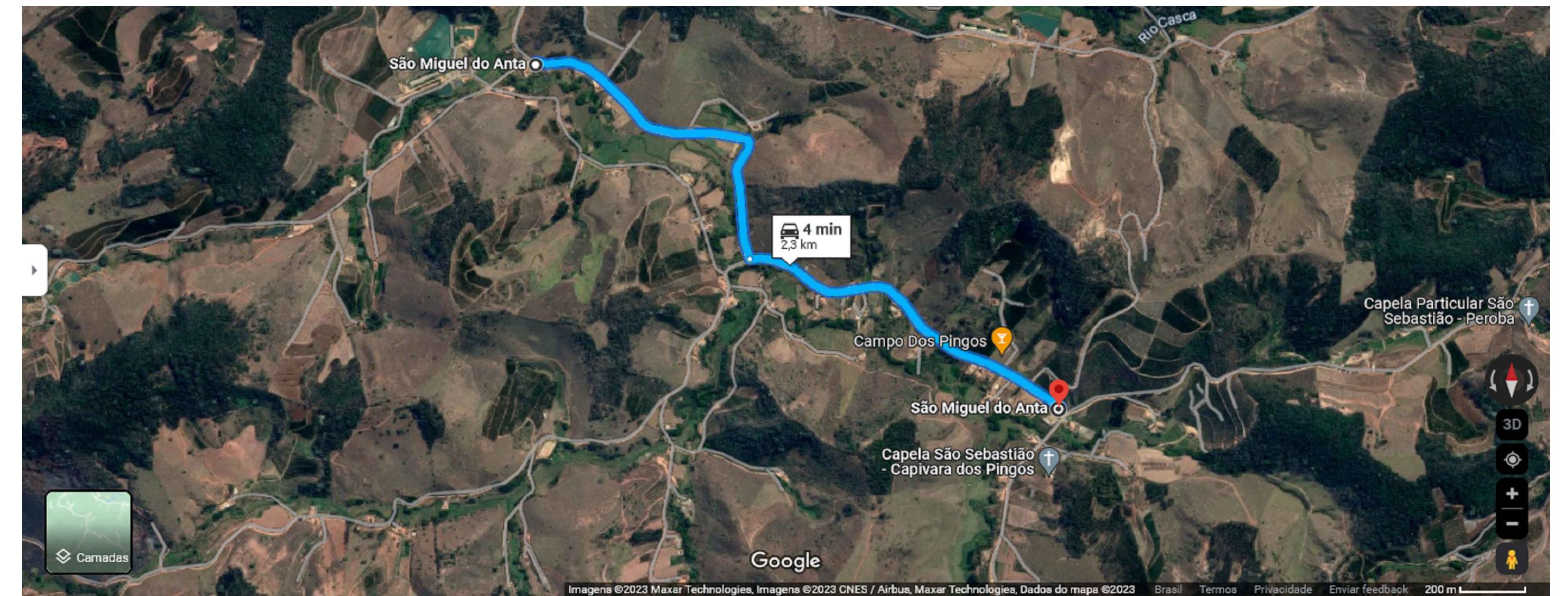
TRECHO 05 - SAO MIGUEL/ERVALIA 2 - 2,3 KM DE EXTENSÃO X 5,00 METROS DE LARGURA