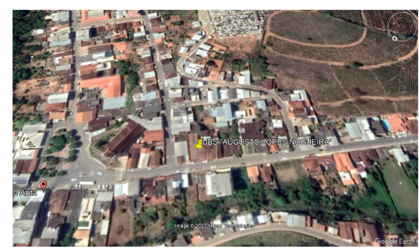
LOCALIZAÇÃO VIA SATELITE SEM ESCALA COORDENADAS GEOGRAFICAS 20°42'25.38"S 42°43'12.61"W